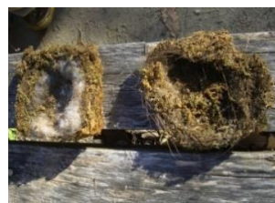
↑シジュウカラの巣↑