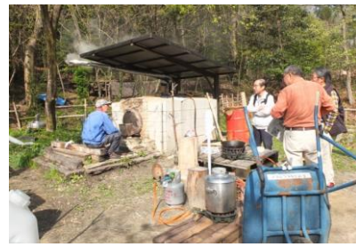
炭焼き 暇持て余し 運営委員会?