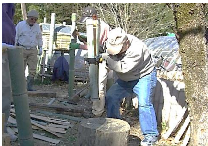
←原料竹を四ツ割り、節除去

午後 炭焼窯煙突用マダケ材伐採、節抜き、竹炭原料(モウソウ):調整、90cm長に切り揃え