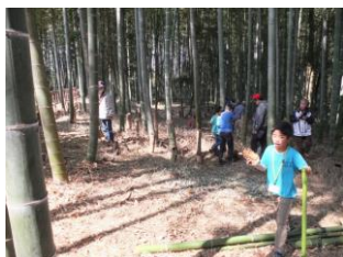
間伐は もりもり隊も奮闘

3月20日(日) サンデー活動 参加 会員30名、もりもり隊8名 竹林整備。昨年以上に孟宗竹の 出がよく、間伐に時間を要しました。 今後も間断なく間伐の必要あり。 竹炭焼き:本年度2回目 午前9時からはじめ、窯を密閉せず 翌日の午前に密閉。